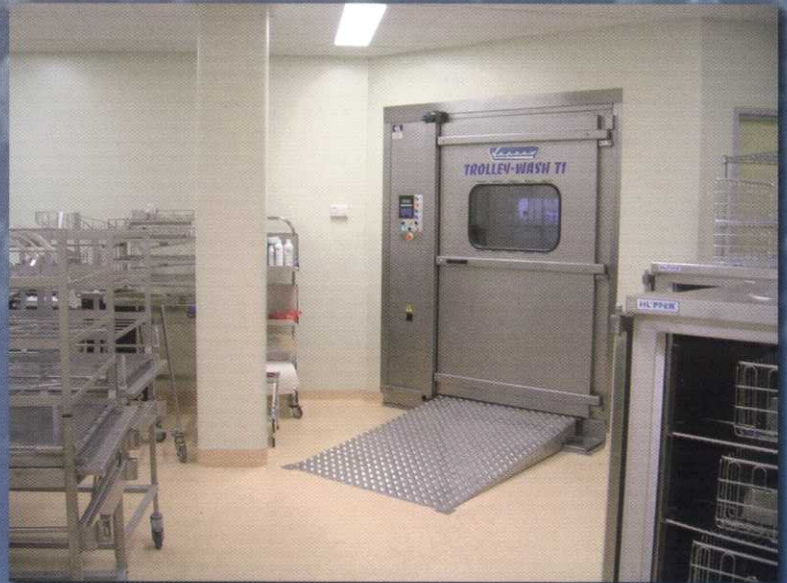
Installations complètes de cuisines centrales Gesamtinstallation von Grossküchen Complete installation of central kitchens